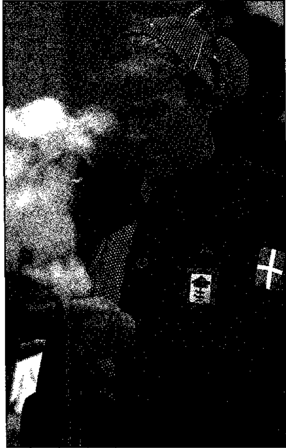
Justina Bringas, hilandera, El Regato, Vizcaya.

actividades es limitada, por lo que los jóvenes buscan nuevas salidas laborales, con la consiguiente pérdida del acervo cultural (al romperse la cadena generacional que, por lo común, asegura la transmisión de las técnicas tradicionales de padres a hijos). Las instituciones no pueden resolver un problema que parece quintaesencial a la propia evolución de los tiempos.