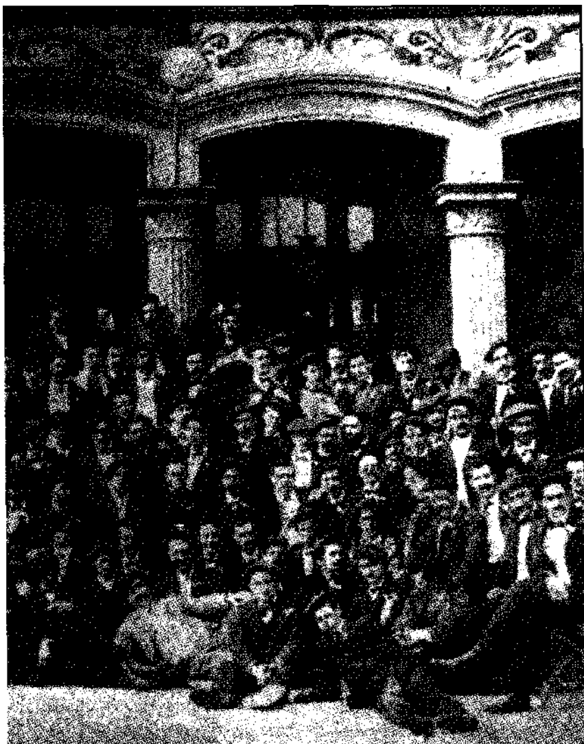
Orfeón Donostiarra, año 1904.

das pero el repertorio de los coros vascos seguía una tendencia fundamentalmente conservadora.