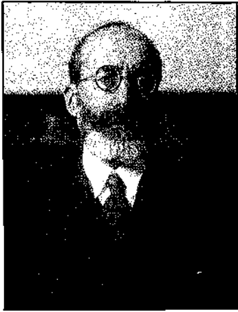
Ramón Menéndez Pidal.

dos de dispendios y alegrías presupuestarias como en la época de la dictadura. Pero esa contracción del gasto público se producía al mismo tiempo que una brutal disminución de la inversión privada causada por la elevación de los salarios y el nivel de vida, que incrementó paralelamente los gastos de las empresas. En cuanto a los gobiernos de centro-derecha, mantuvieron la misma política presupuestaria o la acentuaron y olvidaron por completo la política industrial para concentrarse en el mantenimiento de los precios del trigo en un momento en que además dos grandes cosechas lo dificultaban de manera extraordinaria. Aquí radica la única posible crítica que se le ocurre al reseñador respecto de este libro: se atribuye esa política económica a la CEDA, cuando en realidad lo era de los sectores agrarios más conservadores y no de ella; por otro lado, merece la pena recordar que el giro en el sentido indicado se produjo a partir del momento en que el impacto de la revolución de 1934 alteró las bases más esenciales de la vida política republicana.