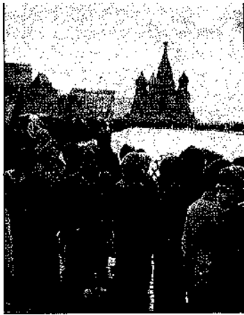
Ciudadanos rusos haciendo cola en la Plaza Roja.

dad con la que explica las circunstancias que vieron nacer la dictadura totalitaria estalinista y el modo espontáneo como él se integró en una «nomenklatura» privilegiada en la que desempeñó un papel de primera importancia. Fue la ilusión revolucionaria y la presión exterior; la barbarie y la ignorancia las que se combinaron en hacer posible aquel régimen que hizo desaparecer de la tierra decenas de millones de seres humanos. Y podía haber eliminado a muchos más puesto que ese régimen contaba con unas armas poderosísimas que el propio Sajarov contribuyó a crear. No se planteó en un primer momento ningún reparo moral respecto de la bomba atómica soviética de la que fue principal inventor. Debía ser para él un instrumento bélico más.