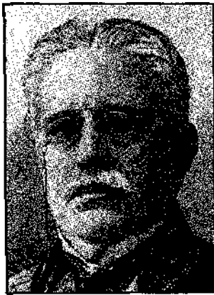
ii. Juan Valera.

no obsta a que el crítico le reconozca nada menos que una personalidad independiente. Y, de corrido, juzga que el lenguaje es español de buena ley. « Usted es usted, ni romántico, ni naturalista, ni neurótico, ni parnasiano. »